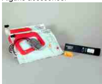
Kit com pás mais Charge Pak