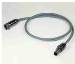
Cabo extensor para o adaptador AC