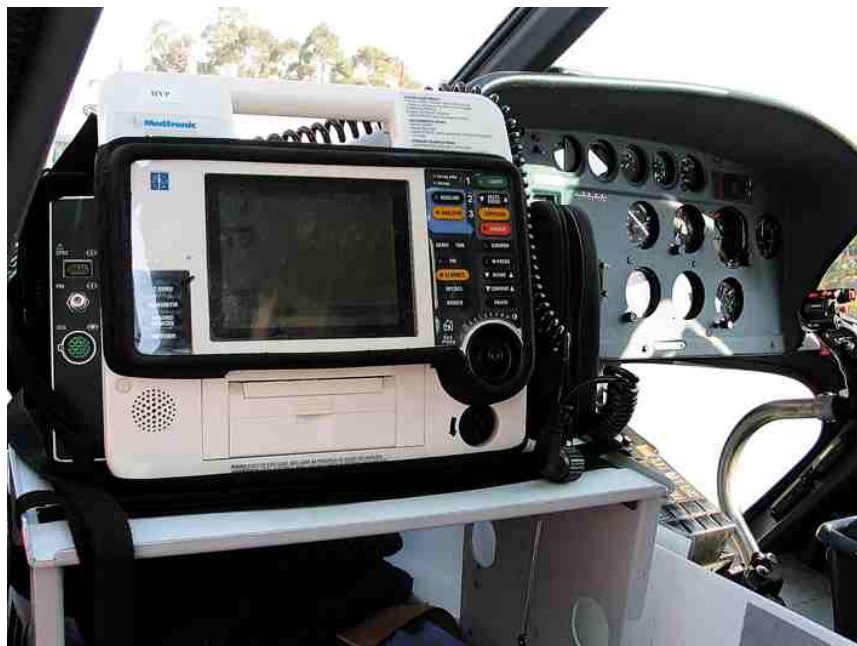
Utilizado em veículos de emergência

Para uso em pacientes adultos e pediátricos, portátil com bateria interna recarregável e entrada de alimentação de 12 volts (corrente contínua), para instalação em veículos de emergência.