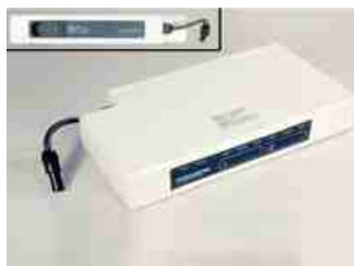
Adaptador de bateria AC